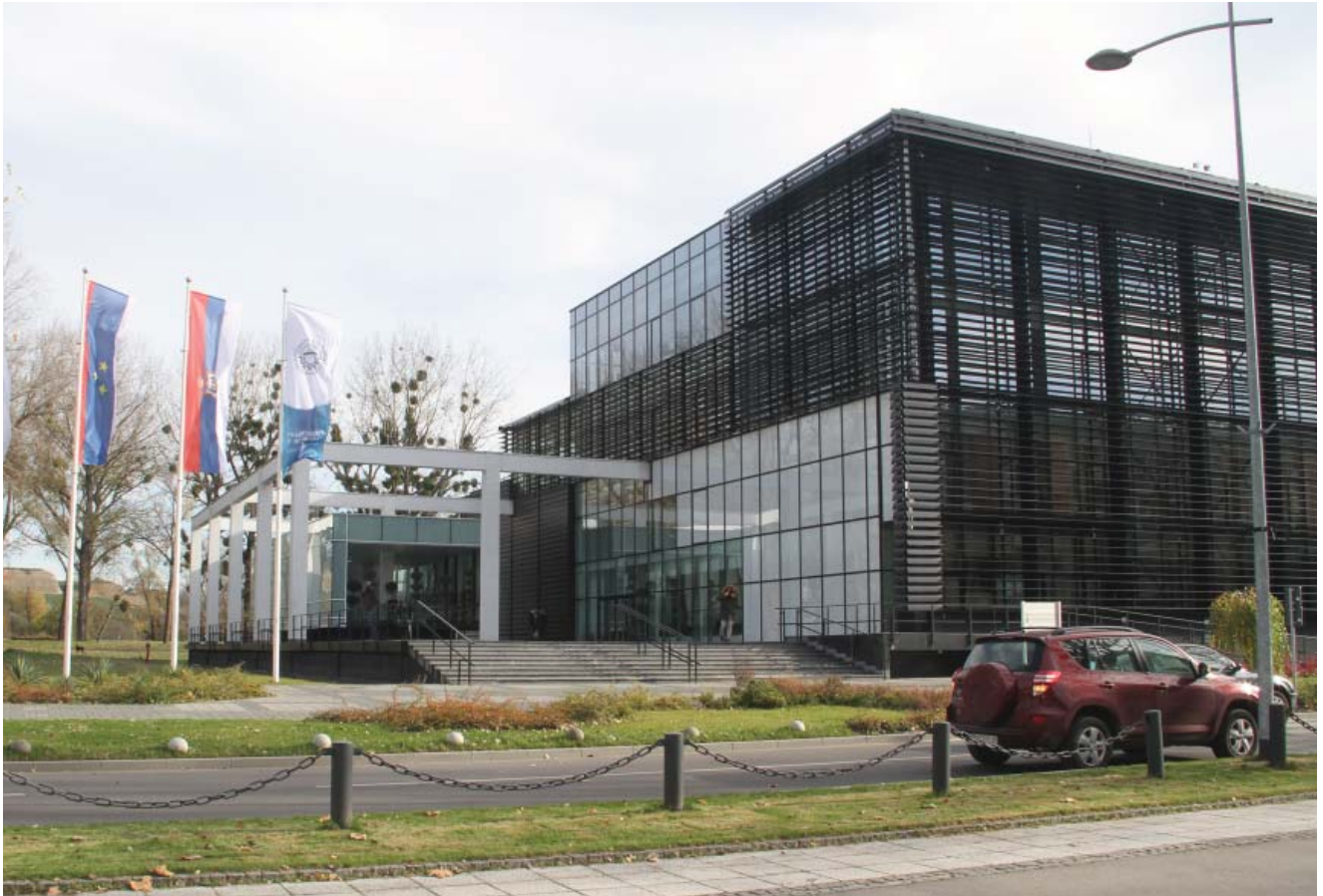
Ректорат Универзитета у Новом Саду Rectorate of the University of Novi Sad

ТАКТОНС-у, могу и сами, својим стручним радовима и првим аудио записима да учествују у такмичарском делу.